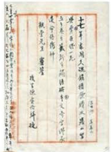
陳寅恪 輓聯悼王國維

趙忠貞是量子物理學家，1930年獲美國加州理工學院博士學位，回國後建立了中國首個核子物理實驗室；王竹溪於1938年獲英國劍橋大學博士學位，回國後任清華大學物理系教授，並曾出任北京大學副校長。